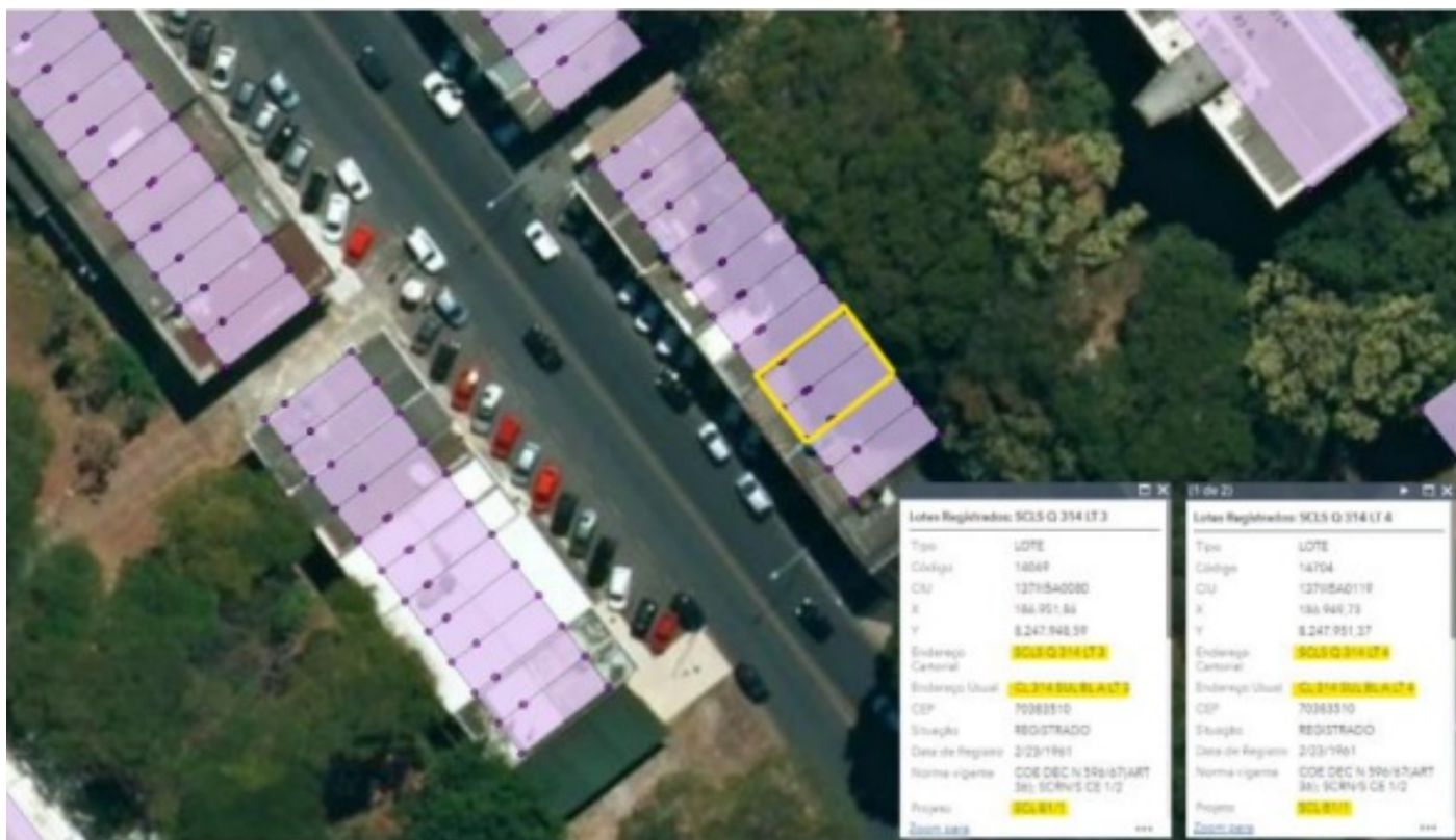
Figura 1: Localização.

Os lotes estão localizados na Quadra 314, do Setor Comercial Local Sul, na Região Administrativa do Plano Piloto - RA I, conforme mapa de localização abaixo, extraído do Parecer Técnico n.º 114/2022 - SEDUH/SELIC/SUPAR/COPAG/DIDER id. 77410003: