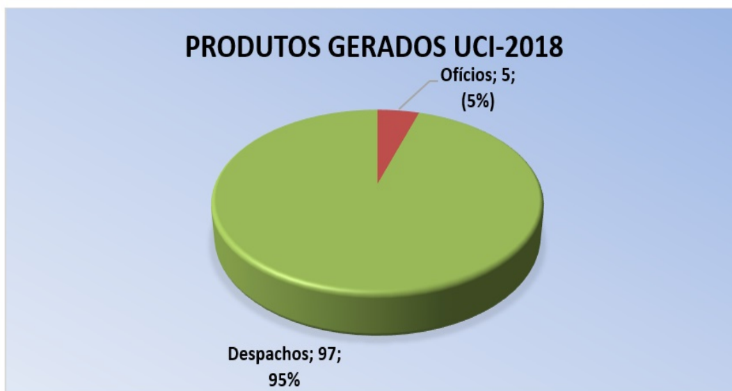
Gráfico I - Produtos Gerados Janeiro a Dezembro de 2018